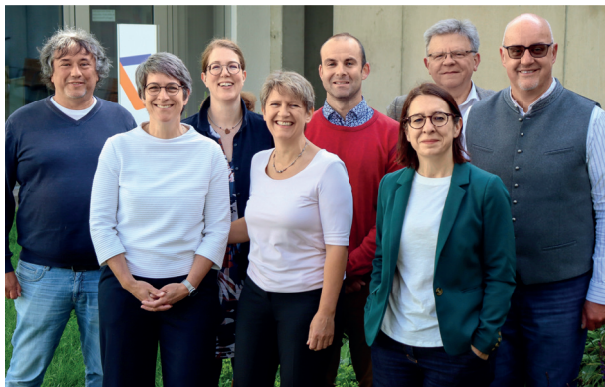
Das Campus-Team von LongLeif, TUM und Caritasverband München und Oberbayern

Altersgerechte Wohnmöglichkeiten und ein breites Angebot an Betreuungsleistungen bieten dafür eine ideale Umgebung. Hier ziehen alle an einem Strang. Dadurch wird der Campus zum attraktiven Anziehungspunkt für Jung und Alt, Wirtschaft und Wissenschaft, lokal verankert in der modernen, zukunftsorientierten Marktgemeinde Garmisch-Partenkirchen.