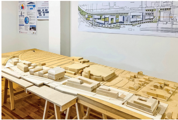
Unser Projektbüro mit Holzmodell

Der Campus Garmisch-Partenkirchen ist ein weltweit einzigartiges Gemeinschaftsprojekt: Die Partner Caritasverband München und Oberbayern, LongLeif GaPa gGmbH sowie Technische Universität München erforschen hier neue Konzepte und Technologien für menschenwürdige, individuelle Pflege und selbstbestimmtes Leben im Alter.