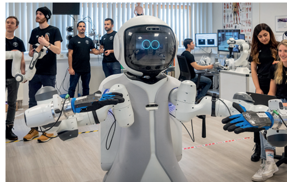
Pflegeroboter GARMI und sein Team

Die Technische Universität München präsentiert mit GARMI einen Assistenzroboter, der die Pflegelandschaft revolutioniert. Ausgestattet mit modernster künstlicher Intelligenz schafft es GARMI in seiner Testwohnung, einem Menschen den ganzen Tag über zur Seite zu stehen. Das beginnt mit der Aufstehhilfe aus dem Bett am Morgen, geht weiter mit dem Bringen oder Abräumen des Frühstücksgeschirrs und der Beantwortung zahlreicher Fragen oder Servicetätigkeiten wie dem Ermöglichen von Telefonaten mit Verwandten und Ärzten. Dabei kann GARMI im Notfall telemedizinische Betreuung leisten - inklusive von ihm behutsam und sicher durchgeführte Untersuchungsleistungen wie Ultraschall. Aber auch zur Anleitung und Begleitung von Rehamaßnahmen eignet sich der Assistent bestens. Damit steigert GARMI die Lebensqualität erheblich.