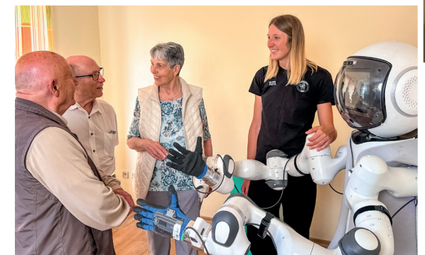
GARMi zu Besuch im Caritas Altenheim St. Vinzenz in GAP